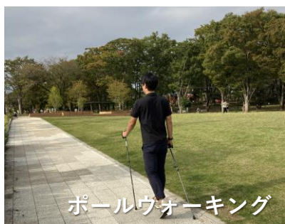
ポールウォーキング