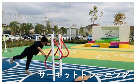
サーキットトレーニング