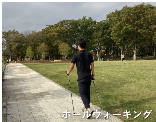
ポールウォーキング