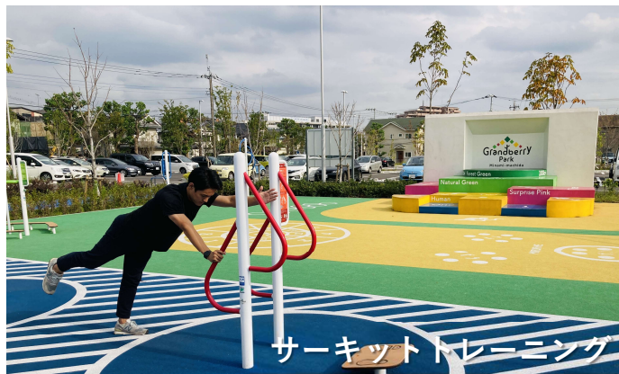
サーキットトレーニング